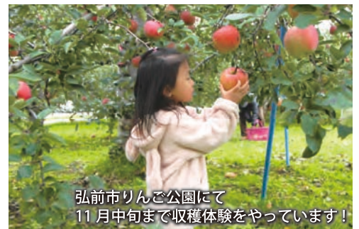
弘前市りんご公園にて 11月中旬まで収穫体験をやっています!