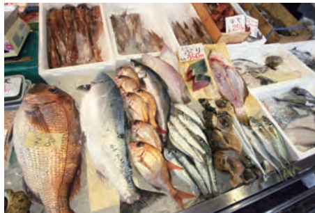
世界自然遺産・白神山地の

白神山地は、今年で世界自然遺産登録20周年を迎えた「ブナの森」です。秋は、たくさんのお木々が色を変え、トレッキングなどに最適な季節になります。森のシンボル「マザーツリー」に会いに、白神山地を歩いてみませんか。