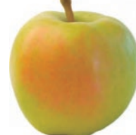
とき 黄りんご。甘酸適和で、香り・食味良好。