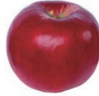
紅玉 赤りんご。加工しやすく、お菓子用などに最適。