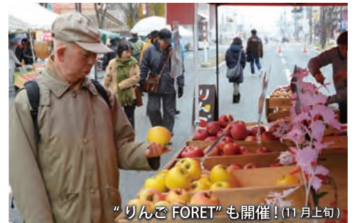
“りんごFORET”も開催!(11月上旬)