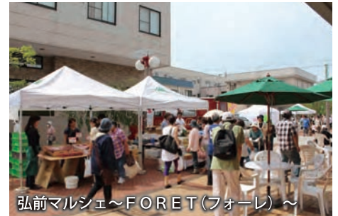
弘前マルシェ～FORET(フォーレ)～

JR弘前駅前にある駅前公園と土手町商店街をつなぐ遊歩道「えきどてプロムナード」。新鮮な農産物で溢れたテントが立ち並び、まさに恵み豊かな森(フォーレ)そのもの。キッチンカーや子どもが楽しめる遊び場などがあり、お買い物だけではなく様々なイベントも楽しめます。もちろん、りんごの収穫時期は、様々なりんごも登場！弘前マルシェ～FORET(フォーレ)～は、10月までの毎週日曜日に開催しています。(午前9時～午後2時)