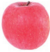
ふじ 赤りんご。甘さ、酸のバランスがとてよい。