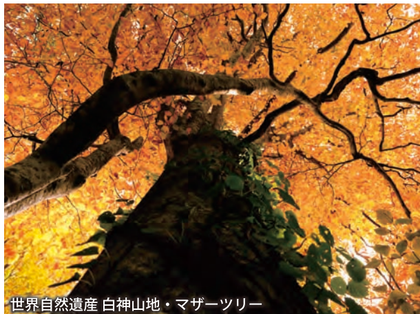
世界自然遺産 白神山地・マザーツリー

JR弘前駅前にある駅前公園と土手町商店街をつなぐ遊歩道「えきどてプロムナード」。新鮮な農産物で溢れたテントが立ち並び、まさに恵み豊かな森(フォーレ)そのもの。キッチンカーや子どもが楽しめる遊び場などがあり、お買い物だけではなく様々なイベントも楽しめます。もちろん、りんごの収穫時期は、様々なりんごも登場！弘前マルシェ～FORET(フォーレ)～は、10月までの毎週日曜日に開催しています。(午前9時～午後2時)