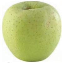
王林 青りんご。微酸、甘味及び芳香が強い。